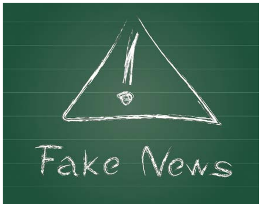
Bei einem postfaktischen Unterricht wären der Kreativität kaum Grenzen gesetzt.