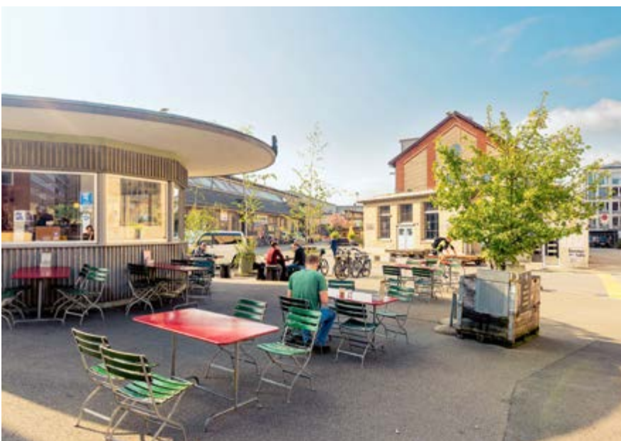
Der Lagerplatz in Winterthur auf dem Sulzerareal lädt heute zum Verweilen ein.