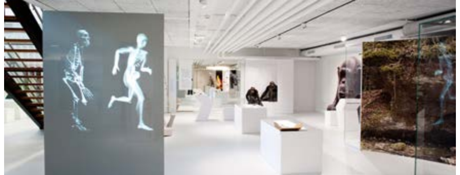
Fragen zur Herkunft werden im Museum beantwortet.

Die Dauerausstellung zeigt, wie Wissenschaftler evolutionsbiologische Methoden anwenden, um auf Fragen zu unserer Herkunft Antworten zu finden. Die biologische und kulturelle Evolution der letzten 3,5 Millionen Jahre bis heute wird in der Ausstellung mittels wichtiger Fossil- und Werkzeugfunde nachgezeichnet. Besondere Highlights sind die auf wissenschaftlicher Basis rekonstruierten Menschenarten: Australopithecus afarensis, Australopithecus sediba, Homo erectus und Homo neanderthalensis. Eine 1:1-Begegnung mit unserem nächsten Verwandten – so verrät das Museum – sei ebenfalls vorgelesen.