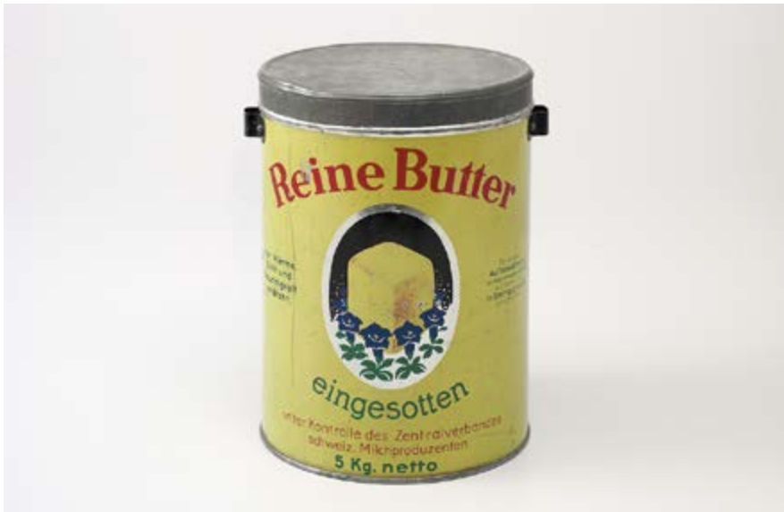
Dose «Reine Butter eingesotten» um 1900–1950.

Forum Schweizer Geschichte Schwyz. Nie zuvor standen wir vor einer grösseren Auswahl an Lebensmitteln als heute. Doch woher kommt das Essen auf unserem Teller? Weshalb essen wir mit Gabel und Messer? Was und wie viel assen unsere Vorfahren und wie sieht die Nahrung der Zukunft aus? Diesen und weiteren Fragen geht die Ausstellung «Was isst die Schweiz?» ab 22. April im Forum Schweizer Geschichte in Schwyz nach. Für Schulklassen ab dem 3. Schuljahr bis und mit Sek II bietet das Team Bildung & Vermittlung altersgerechte und lehrplanbezogene Themenführungen an.